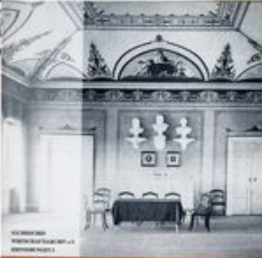
Die Öffentliche Handelslehranstalt zu Leipzig 1831 - 1950 Festschrift zum 170. Jahrestag ihrer Gründung